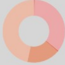
Güncel Fon Dağılım Oranı